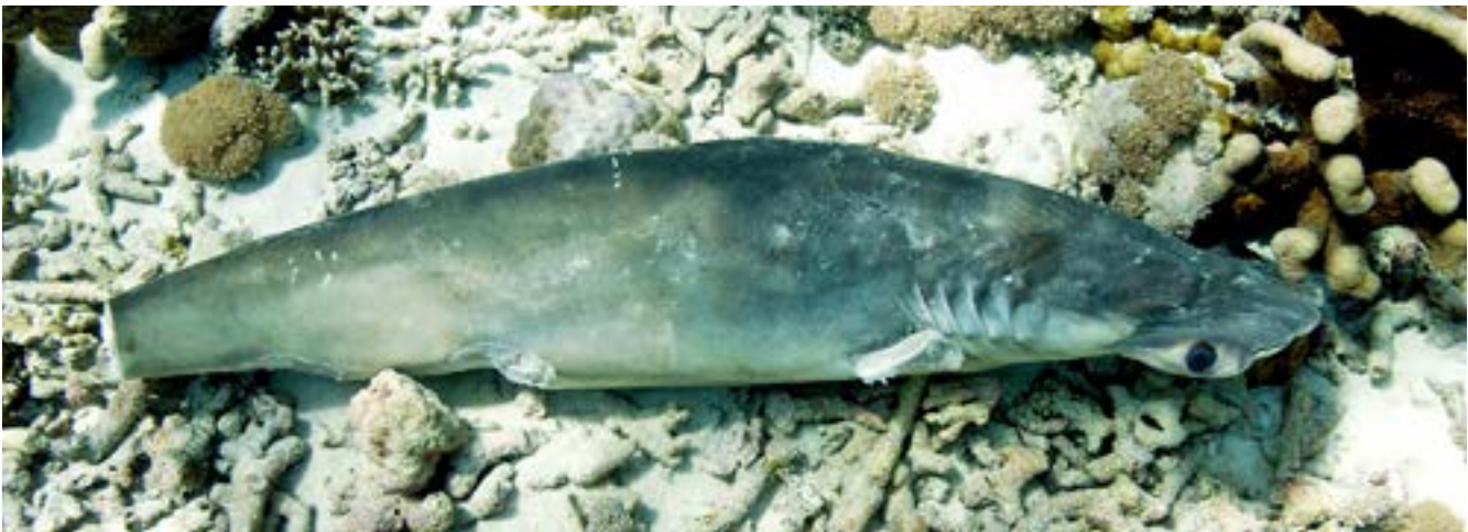
Hiu yang Disirip

Perburuan sirip hiu telah dilarang di banyak negara, meskipun perdagangan internasional sirip hiu diizinkan untuk sebagian besar spesies. Karena perburuan sirip hiu terjadi di laut, tempat pemantauan secara umum tidak dilakukan dengan baik sementara peraturan penangkapan ikan kurang atau lemah, praktik penyiripan hiu berlanjut.