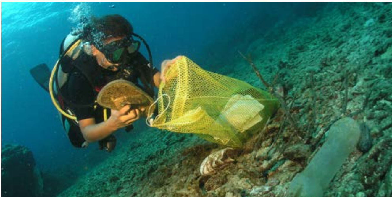
Dive Against Debris®

Banyak populasi hiu berada di tepi jurang kepunahan dan penyelam AWARE yang terus bertambah jumlahnya tidak akan ada lagi menoleransi praktik penangkapan ikan yang tidak lestari. Anda dapat membantu dengan memberi tahu orang lain mengenai kursus konservasi hiu ini, memeriksa situs web Project AWARE sering-sering, menyebarkan informasi ini, dan bertindak.