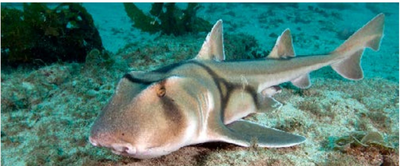
Hiu Port Jackson

Hiu juga memiliki kemiripan ciri-ciri tubuh dengan pari, skate, dan chimaera. Karena kemiripan ciri-ciri tersebut, hewan-hewan ini digolongkan ke dalam Subordo Elasmobranchii.