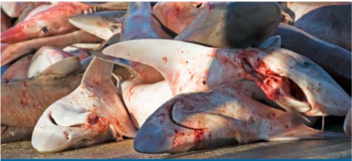
Tumpukan hiu sirip sup (tope) dan hiu sapi di dermaga

Laporan ini memperingatkan bahwa kematian hiu yang sebenarnya di dunia lebih tinggi karena angka ini tidak mencakup hiu yang terbunuh untuk pasar sirip domestik negara penangkap hiu, hiu yang dibuang dengan keadaan mati di laut, atau hiu yang hanya digunakan dagingnya.