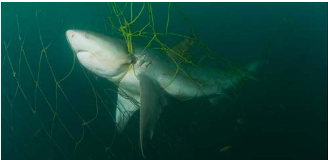
Hiu banteng tertangkap di dalam jaring

Proses IPOA telah berlangsung sangat lambat, tetapi instrumen ini telah meningkatkan profil hiu dan penderitaannya, serta telah menghasilkan panduan yang berguna dan sumber bantuan untuk negara-negara dengan keinginan politik untuk mengelola penangkapan hiu.