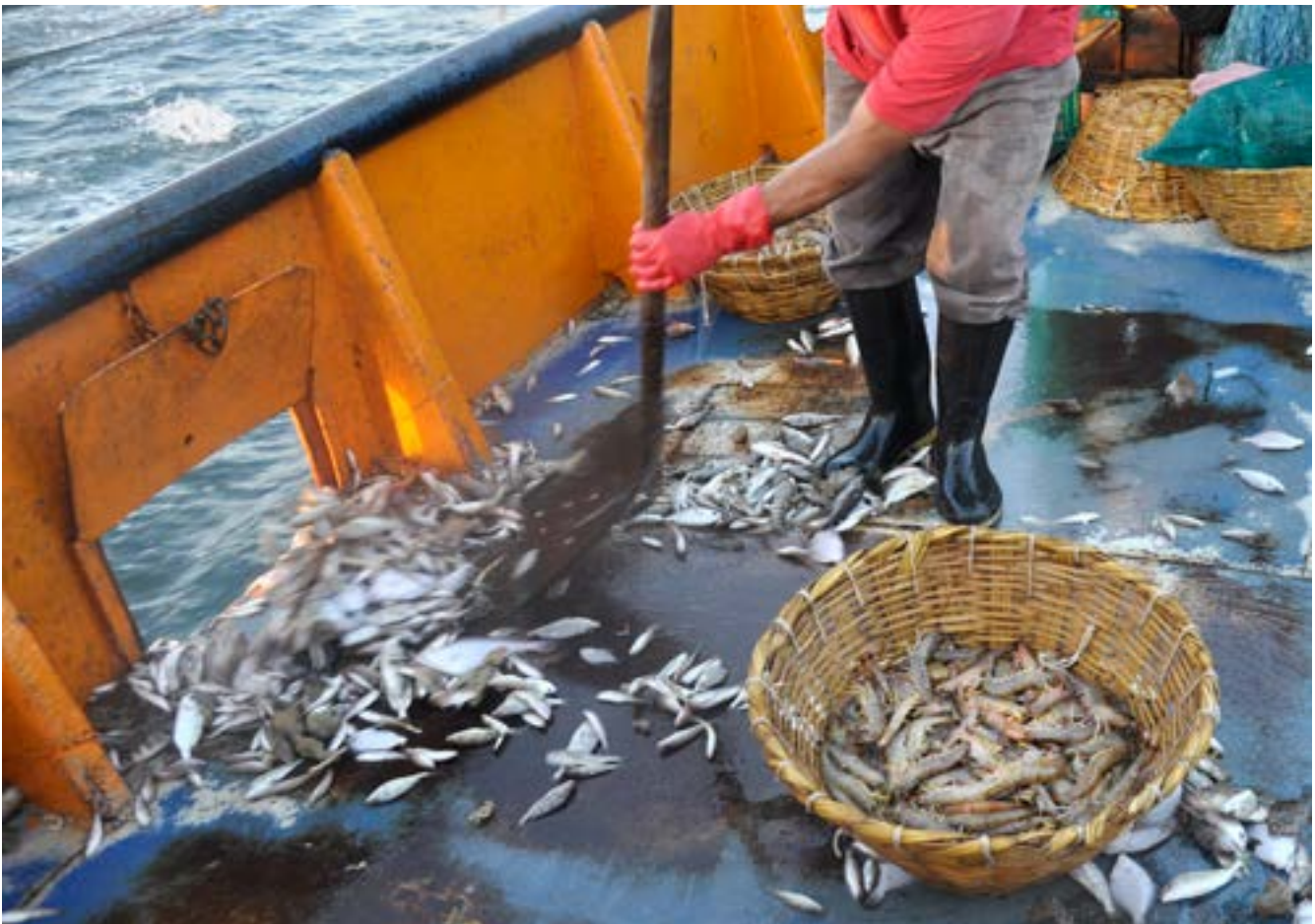
Tangkapan sampingan yang dibuang ke laut