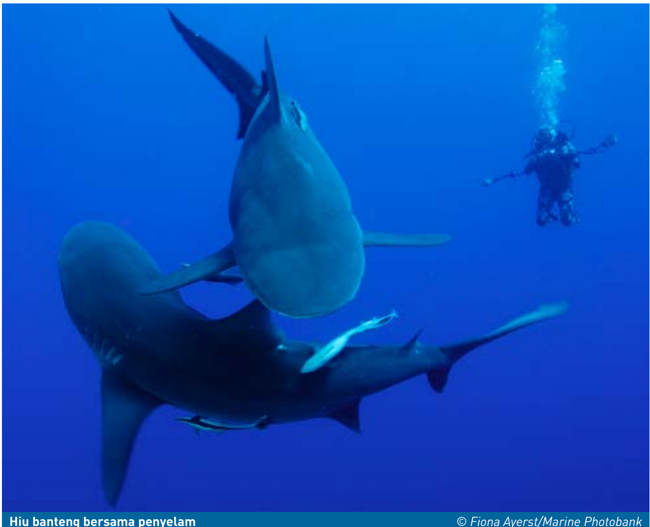
Hiu banteng bersama penyelam

Kurangnya pelaporan tangkapan hiu per spesies adalah rintangan yang sangat besar untuk evaluasi dan konservasi populasi hiu di seluruh dunia.