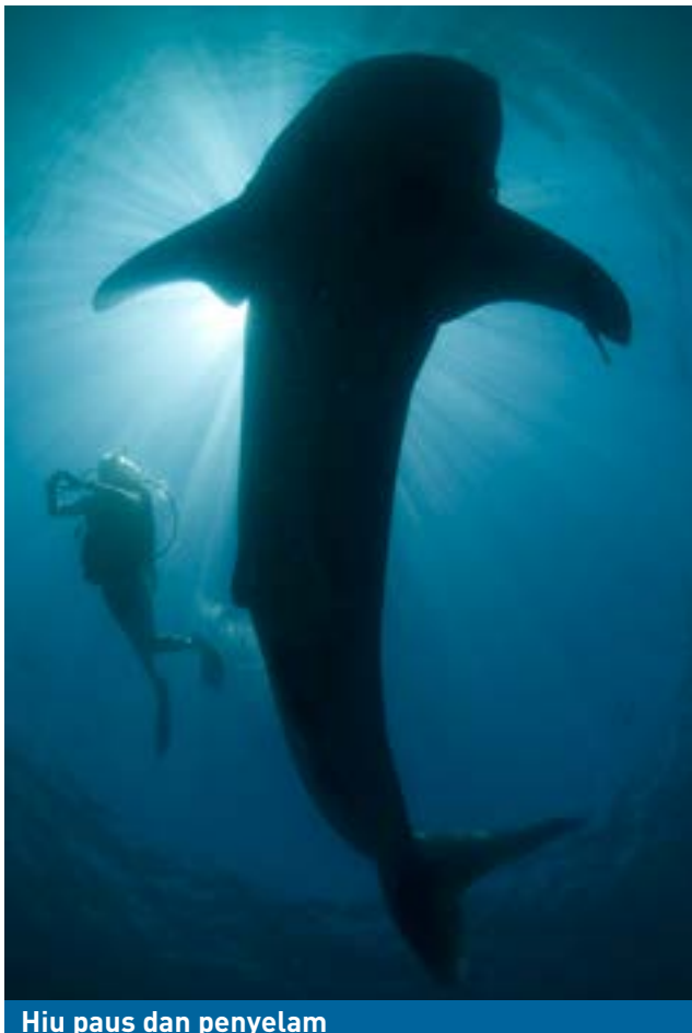
Hiu paus dan penyelam

CITES menyediakan tiga tingkat perlindungan untuk spesies terdaftar. Tingkat tertinggi adalah Apendiks I, yang pada dasarnya melarang perdagangan komersial internasional. Apendiks II mewajibkan pemantauan perdagangan, yang dapat menyebabkan penerapan kontrol jika perdagangan dianggap merusak populasi liar. Sebagian besar spesies yang terdaftar dalam CITES tercantum dalam Apendiks II.